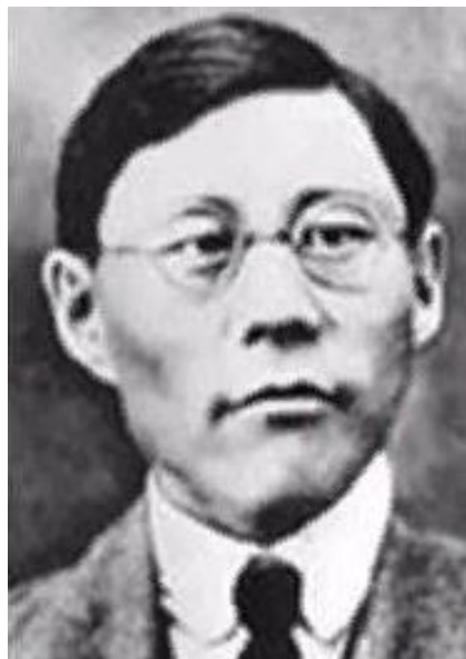
Платон Алексеевич Ойунский

Выдающиеся государственные деятели Якутии – Максим Аммосов, Платон Ойунский Исидор Барахов, Степан Аржаков, стоявшие у истоков нашей республики.